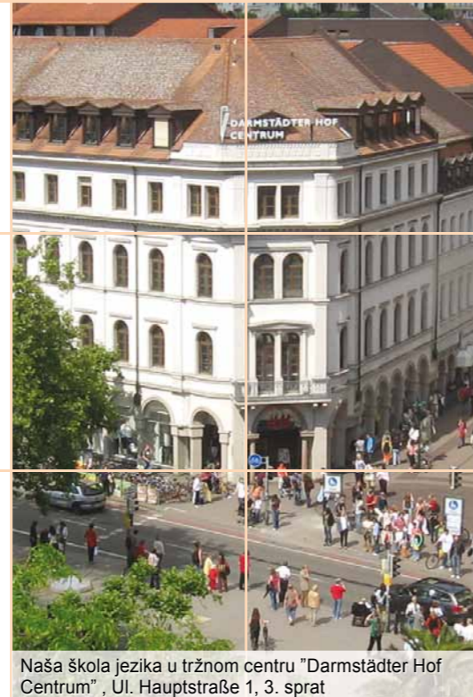
Naša škola jezika u tržnom centru "Darmstädter Hof Centrum", Ul. Hauptstraße 1, 3. sprat